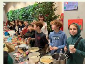
OGTS – Weihnachtsbasar

Spende für „Sternstunden“ und SOS-Kinderdorf